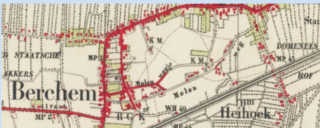
Plattegrond: Berchem met het Molenstraatje als onverharde karweg naar de molen (1945)

Op de kadastrale kaart tot 1948 had de Veldstraat nog de naam Molenstraatje, het was een onverharde karweg vanaf de Laanderstraat (nu Burg. van Erpstraat) tot aan de molen die op de hoek van de latere Veldstraat-Parlevlietstraat stond, nabij het huidige molenhuis Parlevlietstraat 2. Op het eind tussen de huidige Sportstraat/Molenweg heette de Veldstraat toen Molenveld.