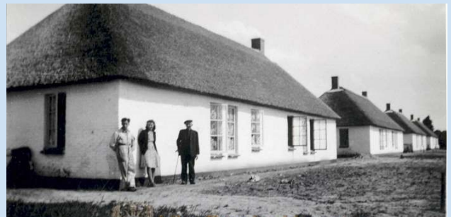
Afbeelding: 'de witte woningen' aan de Veldstraat. (1949)

Het woongebouw aan de Veldstraat 39-41 ook wel 't Kasteeltje' genoemd bevat nog een geheim. In het uivormige dak van het lift-trappenhuis bevindt zich een geheime boodschap van burgemeester Ben Straatsma als handeling bij de opening van het woongebouw in 1974. Deze boodschap dient geheim te blijven tot de sloop van dit woongebouw.