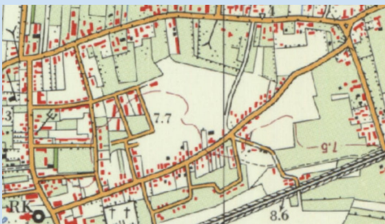
Plattegrond: Locatie en omgeving latere Wolvepad (1970)

Op de topografische kaart van 1970 is de locatie van het latere Wolvepad nog onbebouwde landbouwgrond. Langs de Burg. van Erpstraat en de toen nog geheel doorlopende Molenweg bevindt zich duidelijke lintbebouwing. Het gehele toekomstige woongebied van Berghem is op dat moment nog vrijwel onbebouwd. Op de kaart linksonder de spoorlijn Den Bosch - Nijmegen, en rechts onder de St. Willibrorduskerk aangeduid als RK.