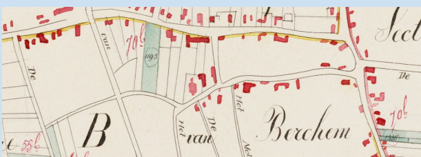
Plattegrond: Mollestraatje Berchem anno 1832

Tot 1948 heette de Sint Willibrordusstraat Mollestraatje, deze naam hangt samen met het woord Maelstand, het is de plaats waar recht gesproken werd. Op de plaats van de kerk van 1400 wordt in 1520 een nieuwe kerk gebouwd. De versterkte toren met de diverse ingemetselde tekens bouwt men in 1531 tegen de nieuwe kerk. De huidige toren stamt uit die tijd, in 1900 is deze toren verhoogd met één sectie, en een ranke spits. De ingemetselde X-tekens en de ruit-tekens wijzen duidelijk op deze gerechtsplaats. Dit schuine dubbele kruis kwam ook voor op de vlag van de Brabantse hertog. Met anderewoorden, hier 'in Berghem' gold naast het plaatselijke ook het Brabantse recht (en niet het Gelderse). Door deze tekens in de Berghemse toren wilde men aan vriend en vijand vertellen: 'Hier zijn wij Berghemnaren in samenwerking met de Brabantse hertog de baas'.