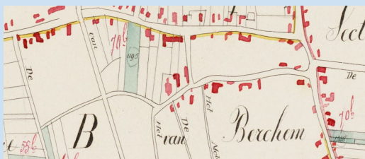
Plattegrond: Rogstraat (bovenin) te Berchem anno 1832

De kadastrale kaart van 1832 geeft de tegenwoordige Julianastraat aan als: 'Weg van Berchem naar Nistelrode'. En in de eerste wegenlegger van 1870 wordt deze straat aangeduid als 'Rogstraat', deze begint bij het 'Plekske' op de hoek van de tegenwoordige Spaanderstraat en Burg. van Erpstraat en eindigde bij het 'Zeepkanneke', nu rotonde. Aan de westkant ligt er, afgescheiden van de klinkerweg, een voetpad met een lengte van 570 meter. Aan de oostkant loopt het voetpad door tot aan de Lange Nieuwe Heistraat (nu Piekenhoefstraat). Aan de Rogstraat stonden diverse boerderijen. Verder enkele cafés, smederijen, bakkerijen, rijwielhandel, maalterij, klompenmaker, groente-fruit, zuivel en grutterswinkels, kleermaker, garagebedrijf en slijterij, ook woonden er de pastoor, burgemeester en veldwachters. Een straat op stand dus.