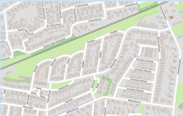
Plattegrond: Heiligenbos e.o. (2022)

De straat Heiligenbos is gelegen ten zuiden van de spoorlijn en verbindt de Hoessenboslaan met de Peerhofstraat.