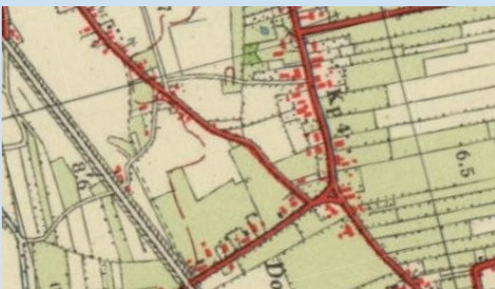
Plattegrond: Locatie en omgeving latere Pater van den Elsenstraat (1960)

Op de topografische kaart van 1960 is de locatie van de latere Pater van den Elsenstraat nog geheel onbebouwde landbouwgrond. Langs de Molenweg en Hoessenboslaan bevindt zich dan lichte bebouwing, langs de Burgemeester van Erpstraat duidelijke lintbebouwing. Het gehele toekomstige woongebied van Berghem is op dat moment nog vrijwel onbebouwd. Op de kaart links de spoorlijn Den Bosch - Nijmegen.