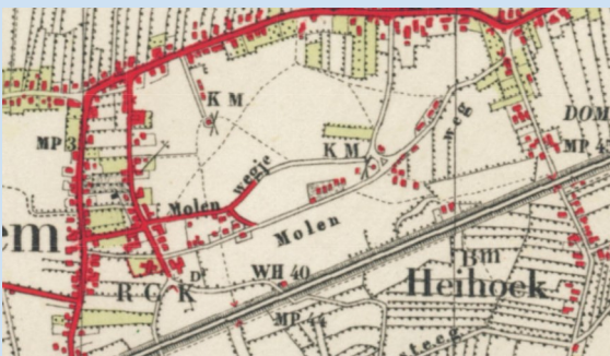
Plattegrond: Locatie en omgeving 't Molenveld de latere Oosterdstraat (1948)

Op de topografische kaart van de kom van Berghem van 1948 is de locatie van Molenveld (de latere Oosterdstraat) nog een onverharde straat met wat bebouwing en landbouwgrond, op de kaart gestippeld aangegeven boven de rechtsonder schuin oplopende spoorlijn Den Bosch - Nijmegen.