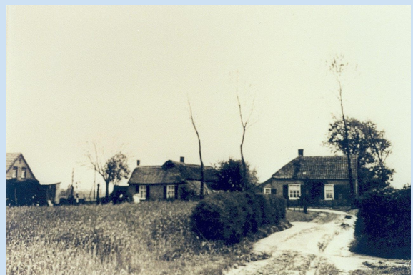
Foto: (oude) Woningen aan de Oosterdstraat (1935)

Op de Grote Tiendkaart van Berchem sectie B van 1885 komen buiten De Oosterd o.a. ook de Laanderstraat, Het Molenveld, Het Bergereind, Piekenhoef, De Heiligen Bosch, De Pachthoeven, De Heihoek, Het Willand, Duurendseind gehucht, De Domenees Hof en De Halve Morgen voor.