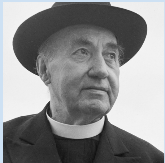
Foto: Doctor Henricus Andreas (Henri) Poels

Poels was een Nederlands rooms-katholiek priester, theoloog en filantroop. Na studies aan de seminaries te Rolduc en Roermond werd hij op 23-jarige leeftijd tot priester gewijd. Na verdere studie in Leuven in de Bijbelwetenschap promoveerde hij daar in 1894 tot doctor in de theologie. Tijdens de spoorwegstaking van 1903 was Poels als kapelaan in Venlo zeer actief, waarvoor hij werd benoemd tot Ridder in de Orde van Oranje-Nassau. Toen Troelstra in 1918 uitspraken deed die bijna tot een nationale revolutie leidden (de vergissing van Troelstra), was Poels een van de eersten die zich tegen hem keerden. In de jaren die volgden, werd Poels vele malen onderscheiden door staat en Kerk. In 1931 werd hij pauselijk huisprelaat.