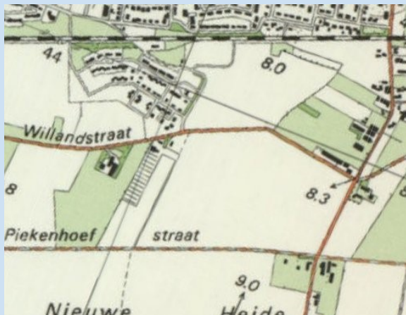
Plattegrond: Berghem-Zuid (1995)

De huidige Hoessenboslaan (rechts) begrenst het gebied in het Oosten, de Willandstraat in het zuiden.