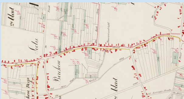
Plattegrond: Laanderstraat Berchem anno 1832 Kaart: archief BHIC

Voor de verdediging van Berghem tegenover Gelder bevond zich aan de Laanderstraat een toren en aan de noordzijde lag de defensiewal - kreupelhout, heggen, sloten e.d..